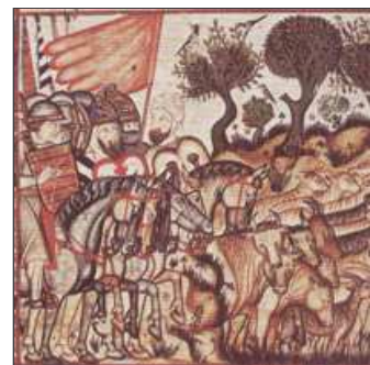
42. I se'n torna cap a Alzira. És aquí on es retira.