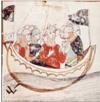
37. De Corbeil, en el tractat en surt com gat escaldat.

El rei de la nostra història que cantem amb més eufòria