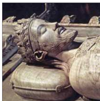
47. Es disposa a anar Poblet, però no hi arriba, pobret.