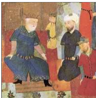
40. Al-Azraq, xeic musulmà, no para de guerrear,