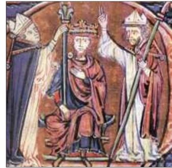
39. Gairebé, el Papa a Lió el nomena emperador.