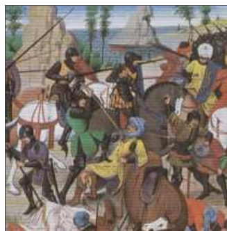
41. ... fins que en el setge d'Alcoi, el derrota el nostre heroi.