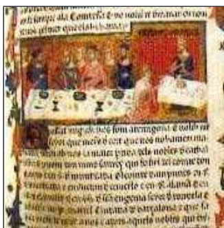
46. I a nosaltres i als seus néts ens deixa el «Llibre dels fets»