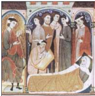
43. El rei Jaume no pot més, va i arregla els seus papers