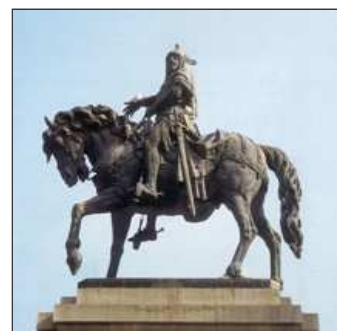
48. Mil dos-cents setanta-sis: Va de dret al paradís.