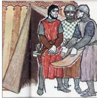
38. Així que Múrcia pot prendre regala el regne al seu gendre.