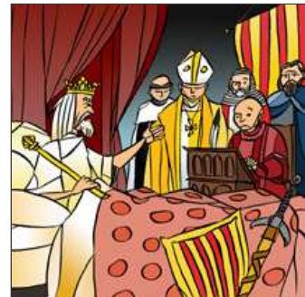
45. Tot Mallorca i Rosselló dóna a Jaume, el fill minyó.