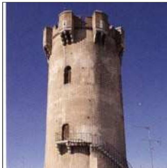
31. Des del Puig emprèn l'atac i València cau al sac.