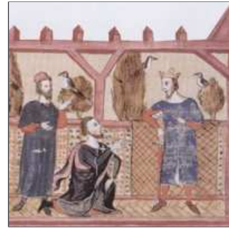
27. ... i fidel li recomana que sotmeti Borriana.