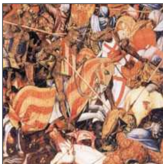
34. La campanya militar cessarà en caure Biar,