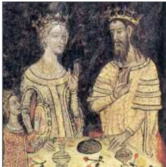
28. Així ho fa i es casa un dia amb na Violant d'Hongria.