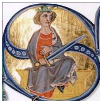
35. ...l'últim feu del nou país, que ara és tot un passadís,