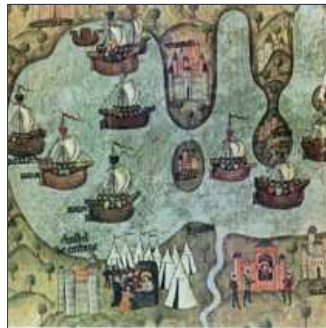
32. Del riu Xúquer fins al Roine tothom se li treu la boina.