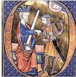
26. Quan veu el rei, el vassall corre i baixa del cavall