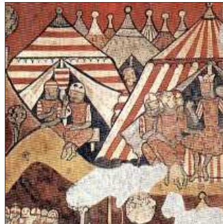
29. Coratjós, però amb paciència, se'n va a conquerir València.