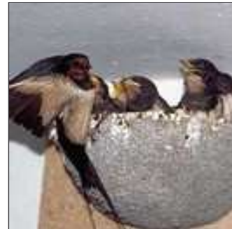
30. I deixa fent la viu-viu orenetes dintre el niu.