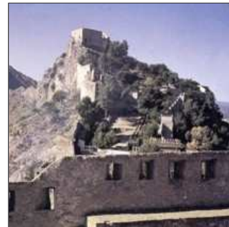
33. Sotmet Xàtiva i Alzira com aquell que va a la fira.