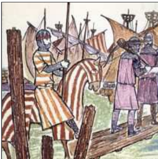
19. ... per fer fora els sarràins de Mallorca, mar endins.