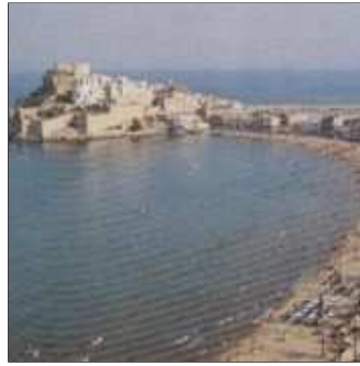
14. ... sinó amb un fracàs rodó: n'ha de tocar el pirandó.