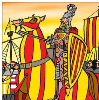
23. ... fins a arribar a l'Almudaina tan lleuger com una daina.