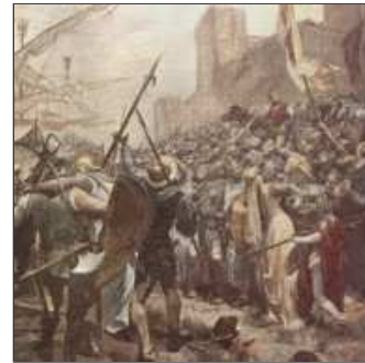
18. ... un matí surt de Salou disposat a fer enrenou