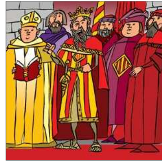
15. Té al seu regne alguns barons, rebels i busca-raons.