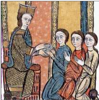
16. ... que se li giren d'espatlla, però aviat els posa a ratlla.