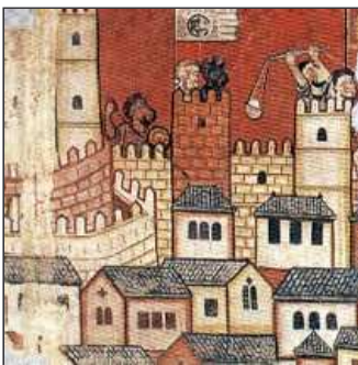
22. ...assetja la capital, que es farà seva al final,