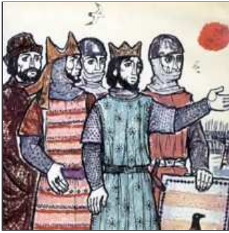
13. A Peníscola fa un setge, que no acaba amb sang ni fetge

El rei de la nostra història que cantem amb més eufòria