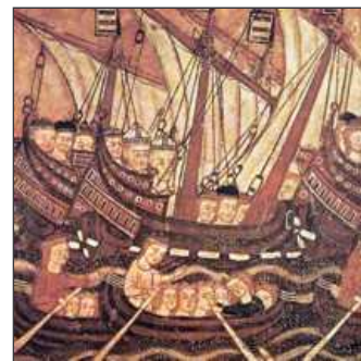
24. La conquesta ha estat rodona i torna per Tarragona.