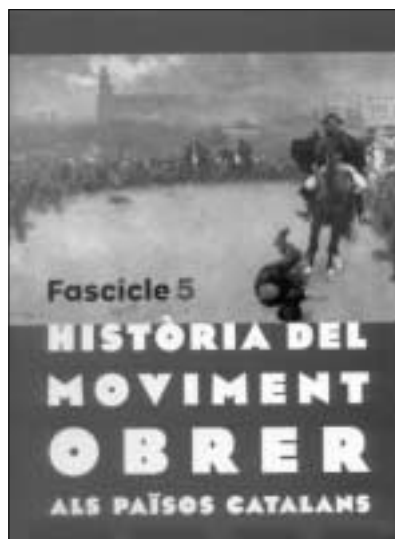
Història del moviment obrer als Països Catalans Col·lecció de setze fascicles col·leccionables. El Temps, València, 2001.

Cal saludar efusivament la iniciativa del setmanari El Temps d'acompanyar cada revista setmanal amb un fascicle que des de l'1 de maig analitza la Història del moviment obrer als Països Catalans.