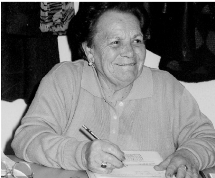
ESCOLA D'ADULTS DE TORRENT

perjudici del respecte a l'autonomia financera de les administracions públiques competents. Els agents socials encara estem esperant que la resta de conse-